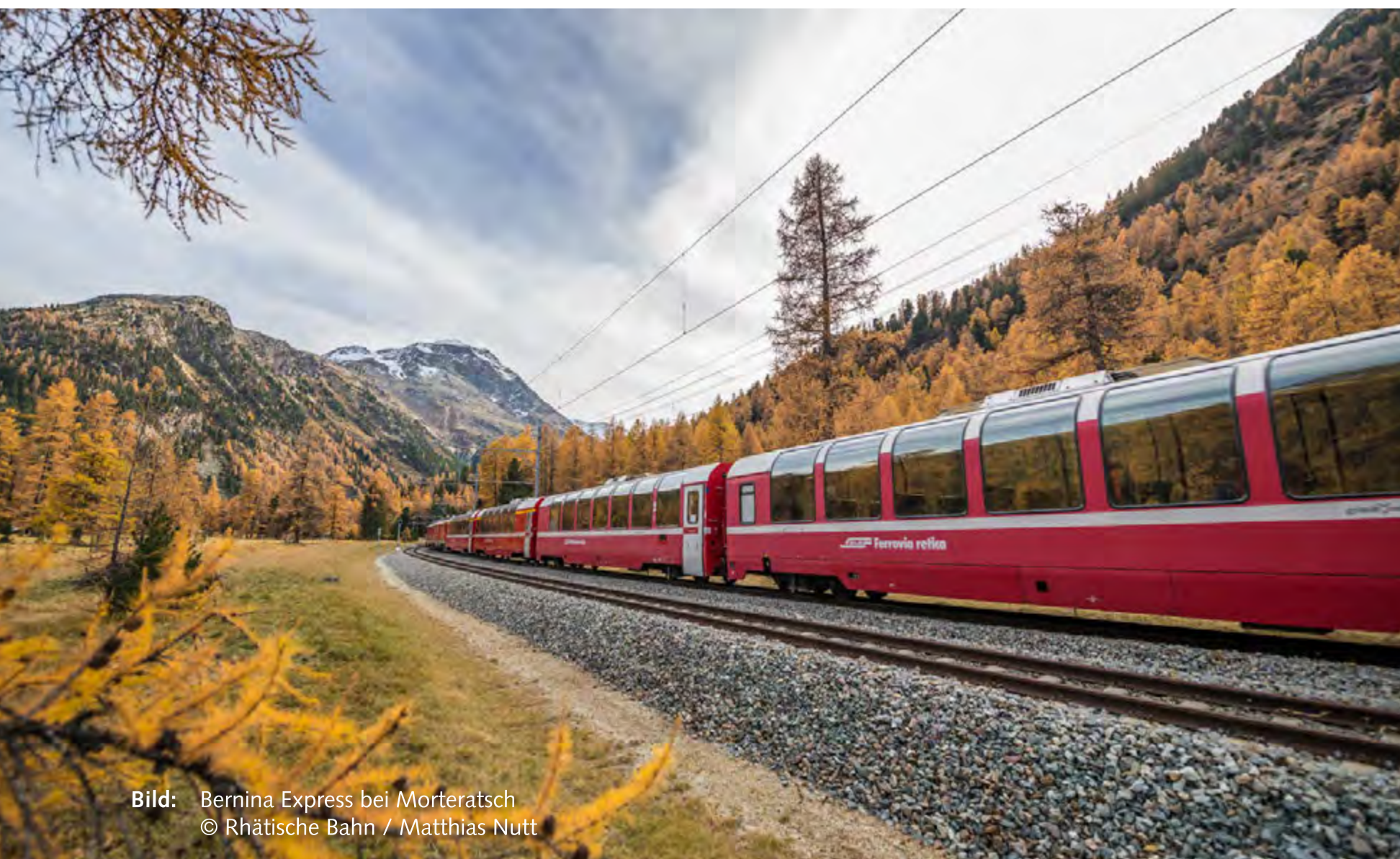
Bild: Bernina Express bei Morteratsch © Rhätische Bahn / Matthias Nutt

Unsere Bahnhofsuhr wurde im Sommer 2013 im Bahnhof Davos-Platz abgebaut und dem Bahnmuseum Albula in Bergün übergeben. Sie wurde wahrscheinlich anlässlich des Umbaus des Stationsgebäudes Davos-Platz 1949 durch Rudolf Gaberel errichtet. Wie Hilfiker steht auch Gaberel im Rahmen der internationalen Moderne der Jahre nach 1930 und prägte das Bild von Davos in den folgenden Jahrzehnten.