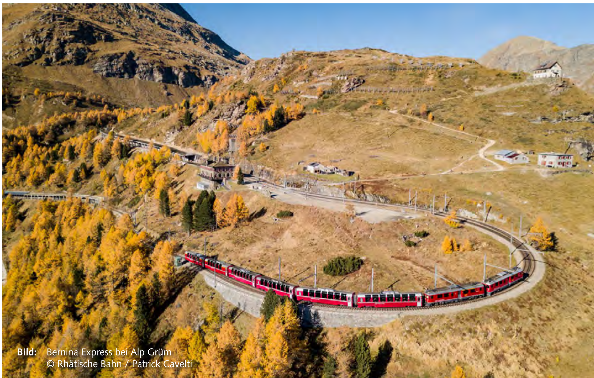
Bild: Bernina Express bei Alp Grüm © Rhätische Bahn / Patrick Cavelti

Noch heute wachsen die Nebbiolo-Trauben des Veltlins auf diesen sonnigen Terrassen und werden in mühevoller Handarbeit geerntet - Rebe für Rebe. Zudem bilden das mediterrane Klima und die hervorragenden Bodenverhältnisse weitere ausgezeichnete Grundlagen für die Produktion der Veltliner-Weine.