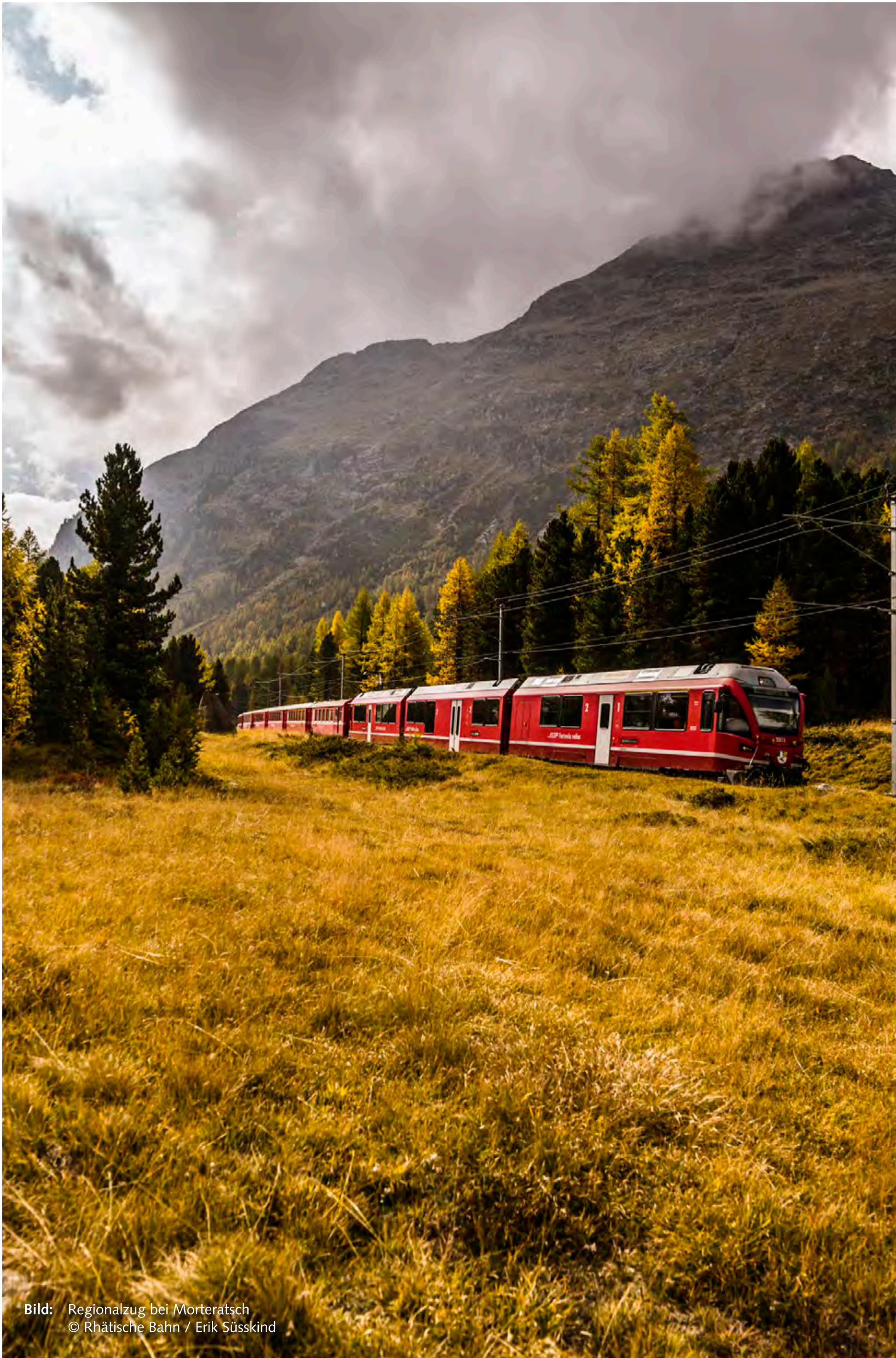
Bild: Regionalzug bei Morteratsch